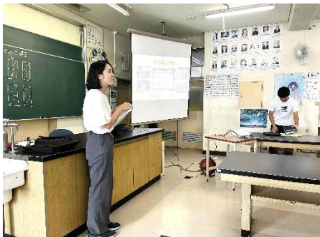
「学級経営研修会」学校課題研修

2学期は各学年の生活科・社会科見学や5年生の大貫海浜学園など、子ども達が楽しみにしている校外学習が行われます。運動会や校内音楽会など、子ども達の活躍の場もたくさん予定されています。