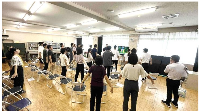
教職員体育実技研修

私たち教職員もこの夏休みを活用して、校内研修を通して日々の授業を充実させる指導法や児童理解について学んだり、緊急時の救急体制について演習を通して理解を深めたりしました。また、日頃できない校舎内の整理、施設設備の点検など、子どもたちの学習環境の整備に努め、新学期のスタートに向けて準備万端整えました。